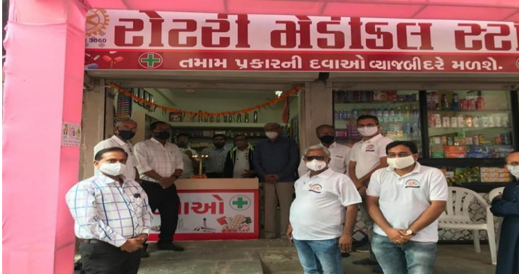
Rotary Medical Store