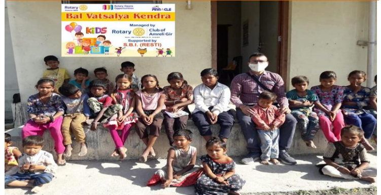
Rotary Bal Vatsalya Kendra